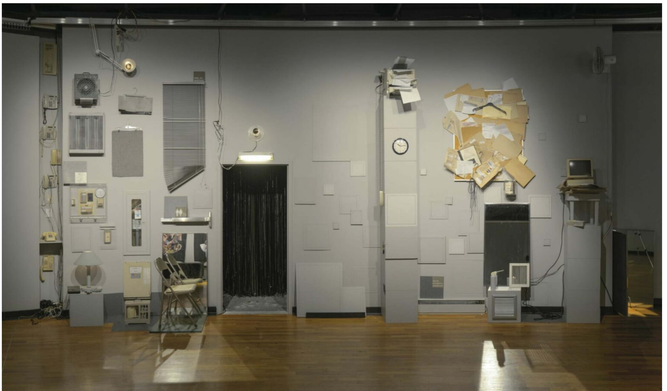
Giorgia Volpe L'ordinaire insoupçonnable , vue d'installation, Maison de la culture Janine-Sutto, Montréal, 2020.

Maison de la culture Janine-Sutto, Montréal du 30 octobre 2019 au 12 janvier 2020